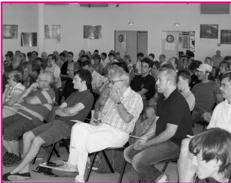
Quelque 200 personnes ont participé à l'Université d'été de R&PS

Et de conclure : «Régions & Peuples Solidaires a soutenu le changement de pouvoir en France. La Fédération sera extrêmement vigilante sur la suite qui sera donnée à ces deux engagements du nouveau président de la République. Pour R&PS, la crise ne pourra en aucun cas servir d'alibi à un retour en arrière sur les engagements pris.»